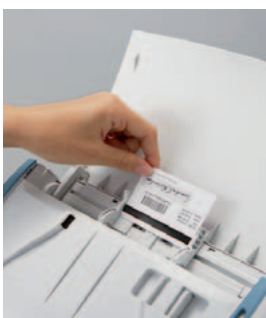
Karten bis zu 0,76 mm Stärke scannen – sogar mit Prägung.

Die Canon-Bildbearbeitung – für optimierte, perfekt lesbare Dokumente.