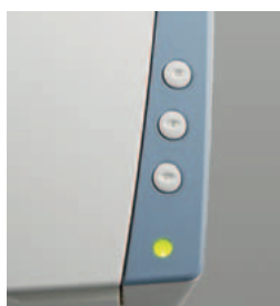
Funktionen wie Scan-to-Mail, Scan-to-File, Scan-to-Print oder Scan-To-Application können unter den Auftrags-Buttons gespeichert werden.

Presto! Bizcard Reader 5 SE – hierüber lassen sich die auf einer Visitenkarte enthaltenen Informationen ordnen und in suchfähige Datenbanken integrieren.